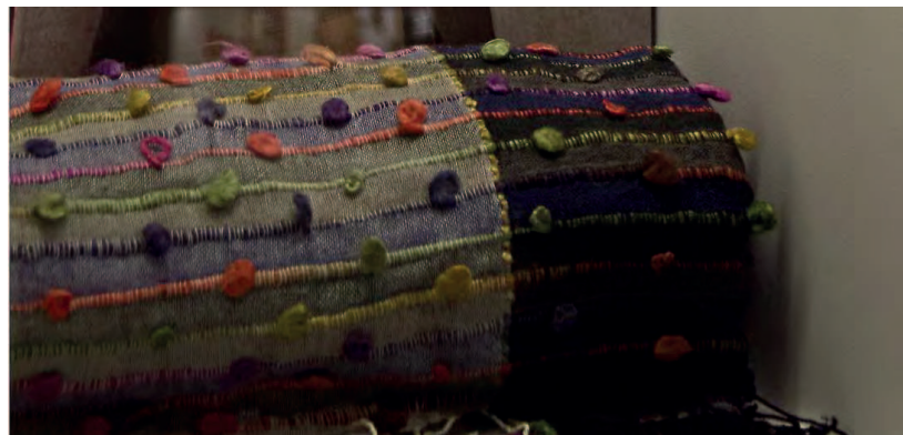
Premierminister Xavier Bettel stellte der Kuratorin einen Schal zur Verfügung